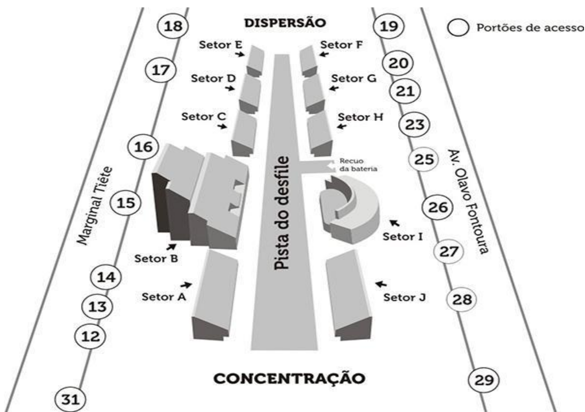
Imagem de Referência - Setores