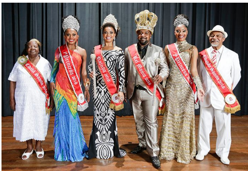
Corte do Carnaval paulistano 2016.

Os novos membros da Corte do Carnaval da cidade de São Paulo foram eleitos na noite do dia 18 de dezembro de 2015, com o Grande Auditório do Palácio das Convenções do Anhembi quase lotado. Toda coreografia do evento foi criada pelo coreógrafo Ismael Toledo, que já fez a parte artística de dança em outras edições da Corte. Ele é especialista em hip hop dance e ritmos latinos, estudou estilos como ballet clássico, jazz, sapateado, dança afro.