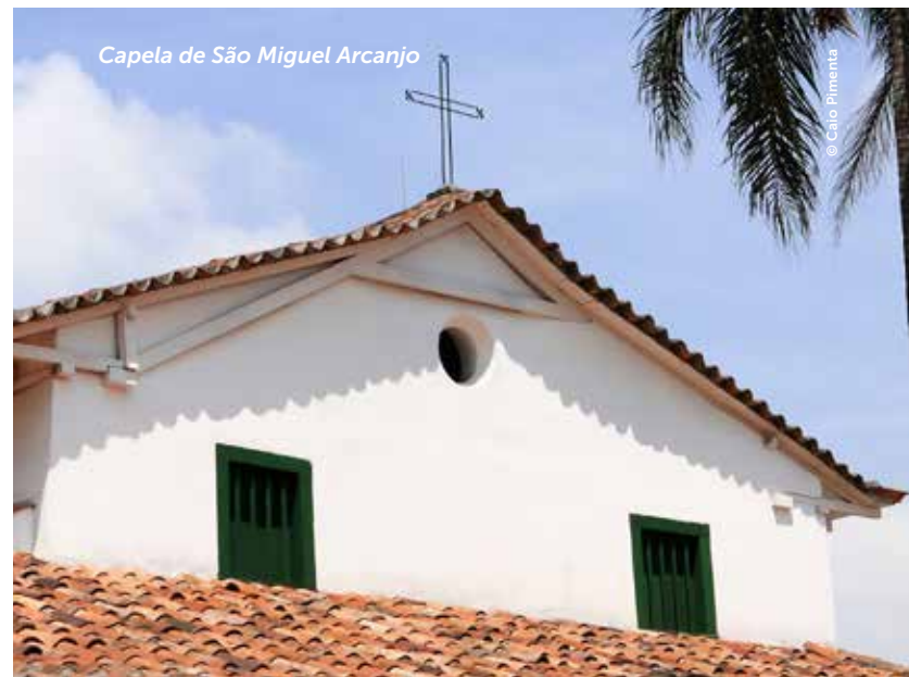
Capela de São Miguel Arcanjo

This neighborhood was founded in 1927 and it has grown with the highest concentration of Eastern Europe-