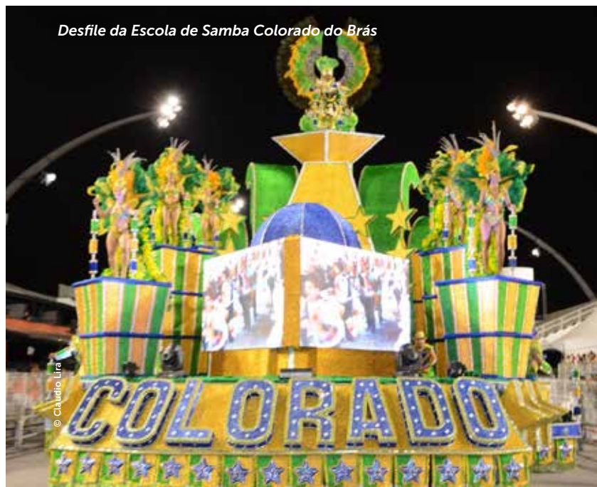
Desfile da Escola de Samba Colorado do Brás

It was established in 1975, by a group of friends, with the purpose of disseminating the Brazilian popular culture and developing social projects for the population in need. It was named after a soccer team in which the founders participated. In 1986 the school