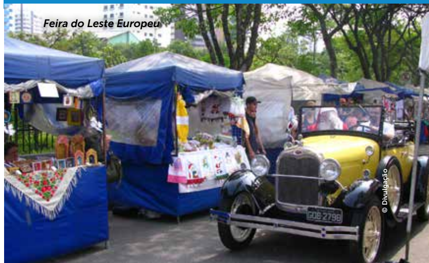
Feira do Leste Europeu

Rua Aracati Mirim – Jardim Avelino (ao lado do Parque Ecológico da Vila Prudente) / (next to the Ecological Park of Vila Prudente); Evento mensal: Domingo, das 10h às 17h. Conferir o calendário no site www.amoviza.org.br Monthly event: Sunday, from 10 am to 5 pm. Check out the events schedule on www.amoviza.org.br