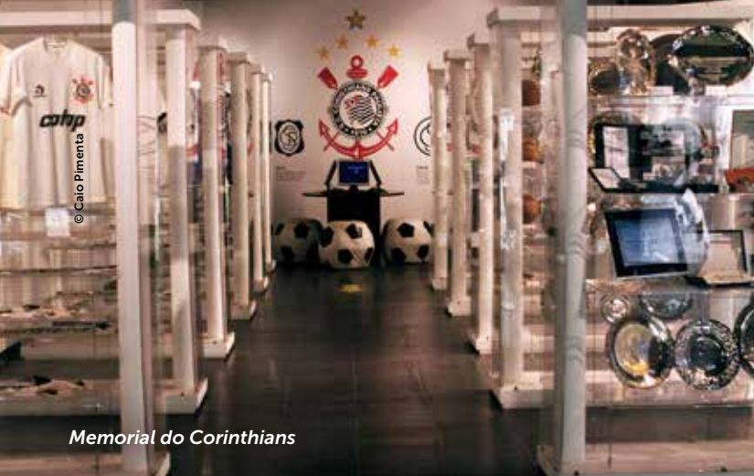
Memorial do Corinthians