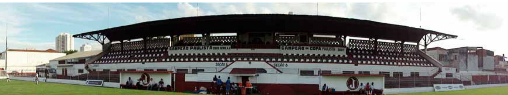
Estádio Conde Rodolfo Crespi - Juventus