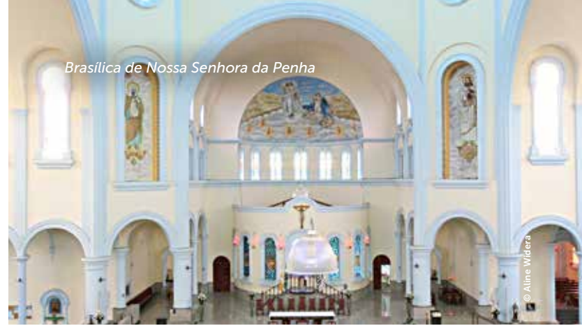
Basílica de Nossa Senhora da Penha

In the mid-17th century, a French traveler stayed in Penha during a trip from São Paulo to Rio de Janeiro. He carried an image of Our Lady, however it had disappeared. So the Catholic returned to look for the image and he found it on the hill where he had slept. He continued to walk and once again the statue went missing. He returned to the hill again and the Saint was there. And for this reason the believer understood that there should be built a chapel to pay tribute to Our Lady. The neighborhood's origin is directly related to the construction of the church in 1667. The main routes, that are the busiest today, were drawn from it. Its original building was made of rammed earth. Over the years, it has undergone several renovations to preserve the history of the chapel and the neighborhood, in addition to rescuing the believers' place of worship. São Paulo inhabitants' devotion to Our Lady of Penha de França was such that, any time there was a disaster in the city, one would turn to the Saint