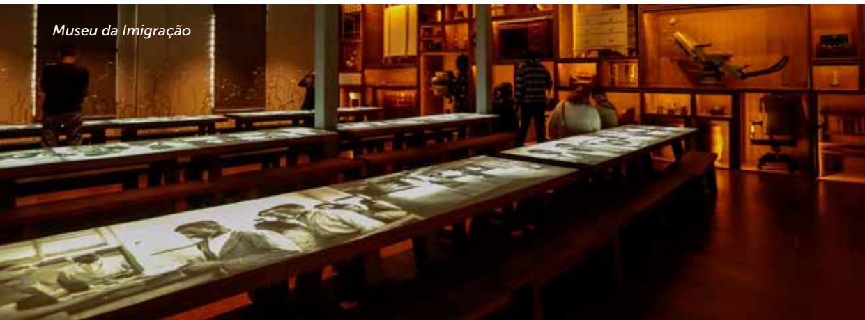
Museu da Imigração