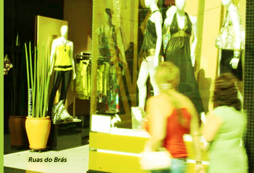
Ruas do Brás

Antes os produtos eram vendidos em atacado, agora o