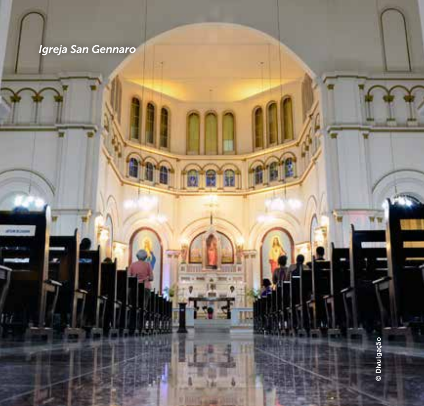
Igreja San Gennaro