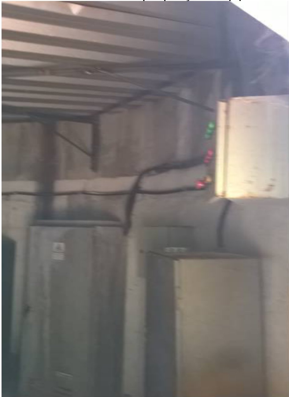
FOTO A1 – Detalhe da cobertura interna para proteção dos equipamentos elétricos