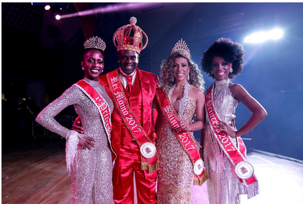
Corte do Carnaval de São Paulo 2017.

A nova composição da Corte do Carnaval 2017 foi definida em cerimônia ocorrida na noite do dia 1º de fevereiro, no Anhembi.