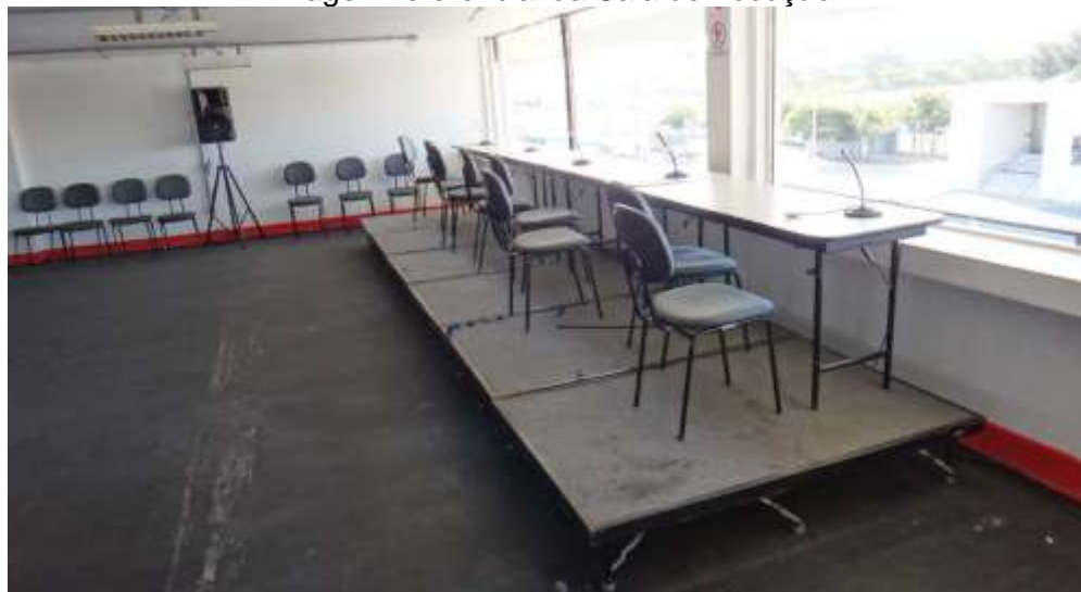
Imagem referencial da Sala de Locução