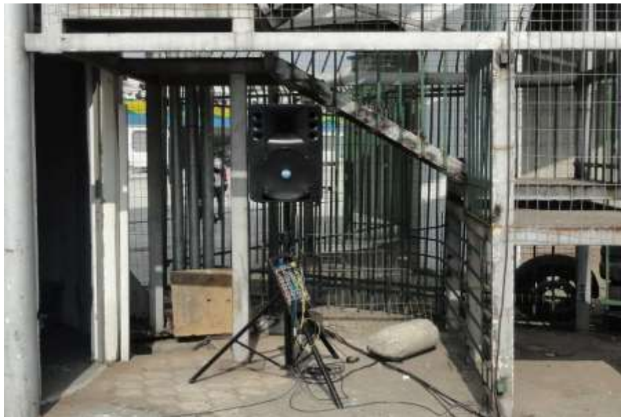
Imagem referencial da sonorização na Área de Imprensa