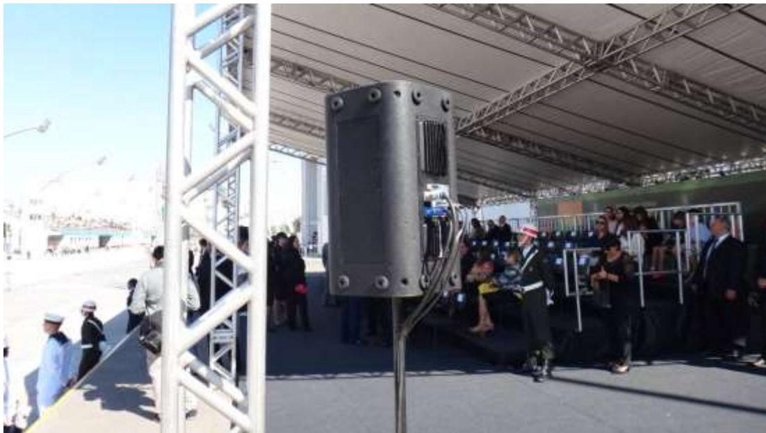
Imagem referencial das caixas na Tenda Palanque