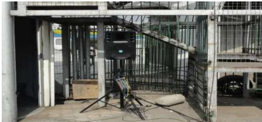
Imagem referencial da sonorização na Área de Imprensa