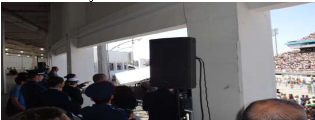
Imagem referencial das caixas no mezzanino