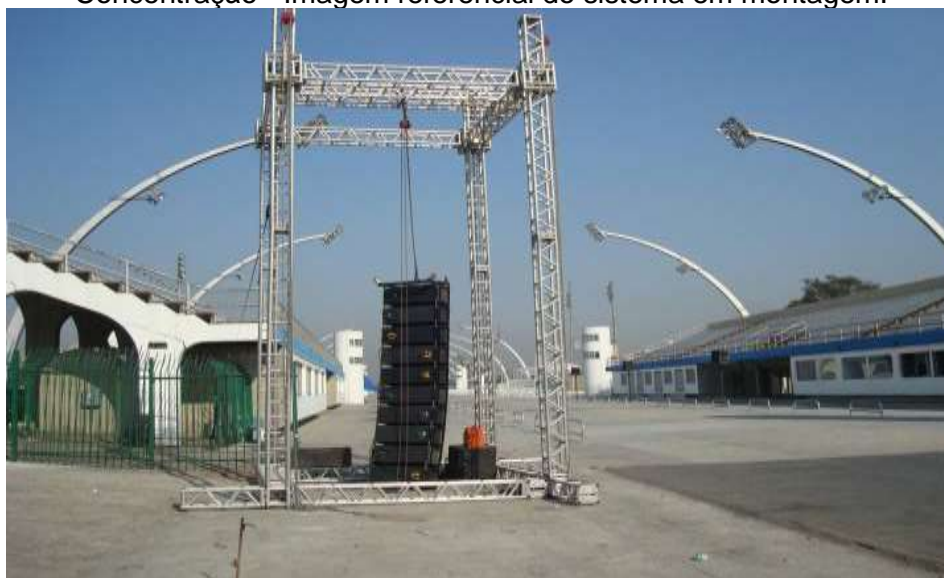
Concentração - Imagem referencial do sistema em montagem.