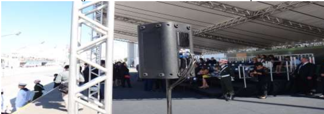
Imagem referencial das caixas na Tenda Palanque