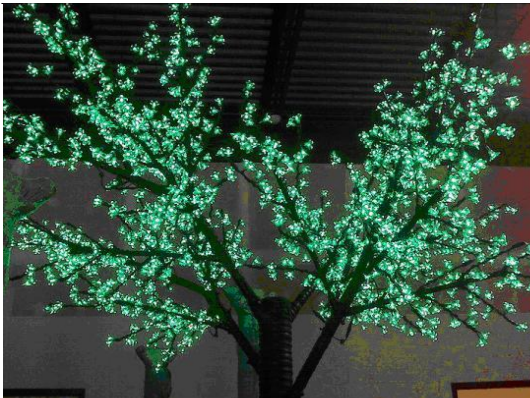
Figura 5 – Detalhe – Flores artificiais com LEDs