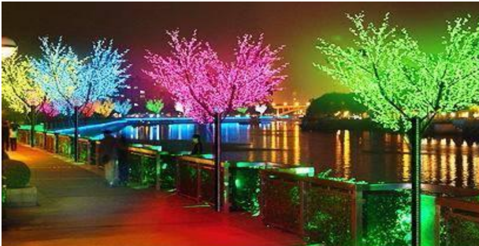
Figura 1 – Imagem de referencia –Arvore Artificial Luminosa