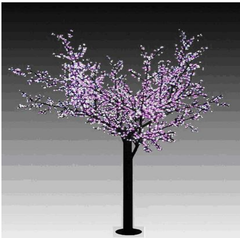
Figura 4 – Imagem de referência –Arvore Artificial Luminosa.