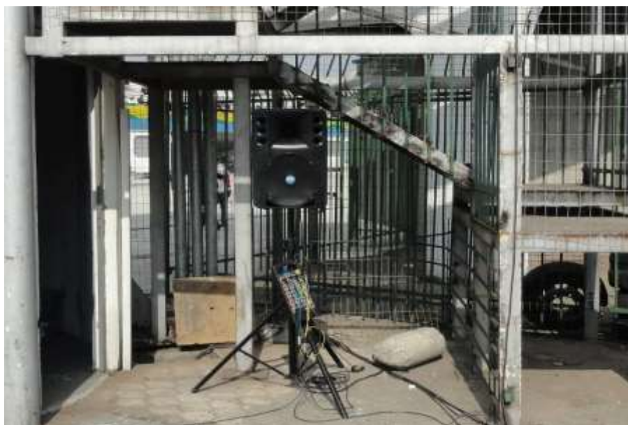
Imagem referencial da sonorização na Área de Imprensa