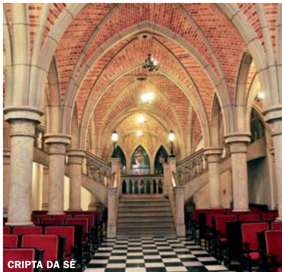
CRIPTA DA SÉ