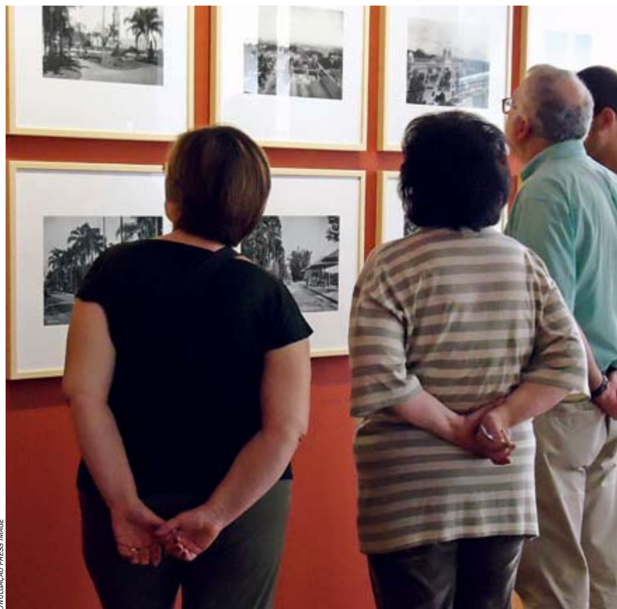
Casa da Imagem has an archive of 710,000 photographs that illustrate São Paulo's history Casa da Imagem: acervo de 710 mil fotografias conta a história de São Paulo

CARONA CULTURAL When you get offered a carona , or a ride, it's usually just a way to get from point A to B – but in the case of Carona Cultural, it's quite the contrary. These personal guided tours offer meaningful excursions to the most interesting performances, concerts, exhibitions, and little known, but important São Paulo architectural landmarks. Reserve Carona Cultural by email, andrea@caronacultural.com.br, or by telephone on 9867 4409 and 3088 0269.