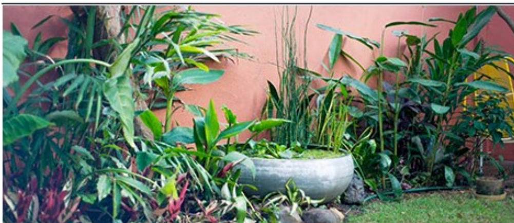
Alice Hostel.

Bem localizados, com boas instalações e, principalmente, preços acessíveis, os hostels têm se tornado a alternativa de hospedagem cada vez mais procurada pelos turistas que vêm a São Paulo. Atualmente, há mais de 60 espalhados pela cidade.