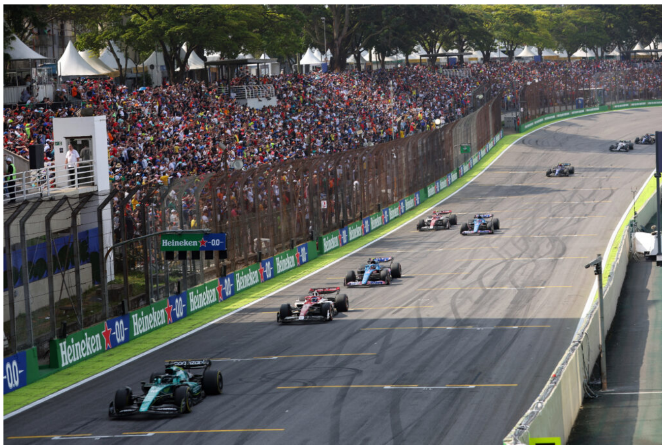
Grande Prêmio São Paulo de Fórmula 1 lota o Autódromo de Interlagos a cada ano.

Fecham a lista nove eventos esportivos, entre eles a Fórmula 1, três maratonas e a Corrida de São Silvestre. Onze eventos foram incluídos na categoria “outros” e incluem a Jornada do Patrimônio, que acontece em diversos pontos da cidade, e a São Paulo Fashion Week. Para efeito de contabilização do público não foram considerados os eventos públicos Virada Esportiva e o Réveillon da Av. Paulista.