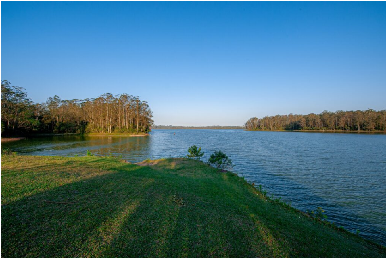
Mirante no Polo de Ecoturismo de São Paulo.

Congresso e Feira de Ecoturismo e Turismo de Aventura acontecem de 1º a 3/12 na Oca do Ibirapuera