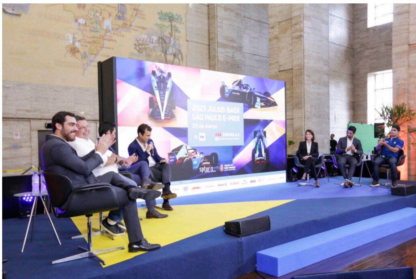
Lançamento da São Paulo E-Prix.

A Prefeitura de São Paulo e a ABB FIA Fórmula E World Championship anunciaram nesta quinta-feira (13) a realização da primeira corrida de Fórmula E no Brasil, que acontecerá no dia 25 de março de 2023, num circuito no Sambódromo do Anhembi, tendo como patrocinador principal e detentor dos naming rights do evento, o Julius Baer. O contrato para realização do evento é válido por cinco anos, com a possibilidade de renovação por mais cinco anos.