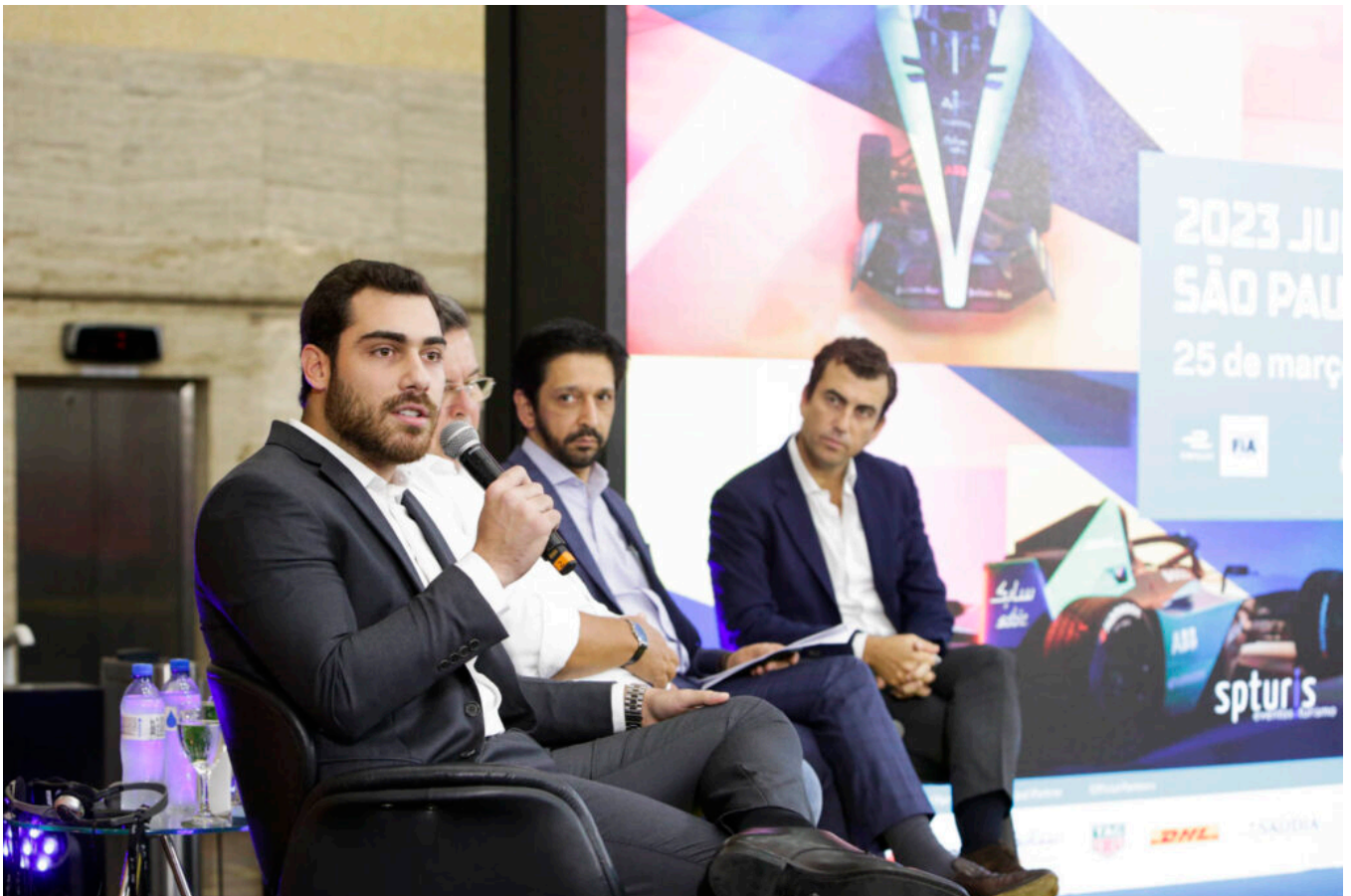
Gustavo Pires, diretor-presidente da São Paulo Turismo.

Vinte e dois pilotos representando 11 equipes irão disputar posições roda a roda em um novo e emocionante circuito no Sambódromo, desenhado para proporcionar ação a altas velocidades e com mínimo impacto no tráfego diário da cidade.