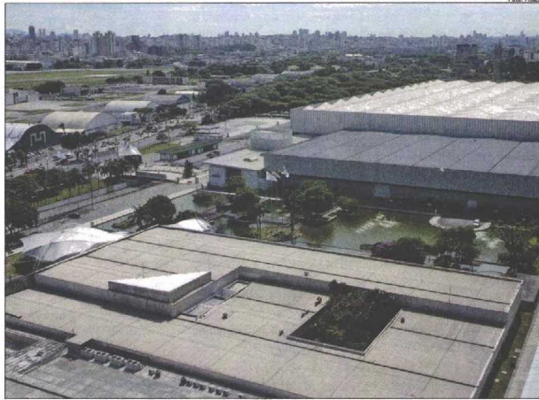
Novo Anhembi trará mudanças para toda região do complexo e monotrilho facilitando acesso ao Metrô